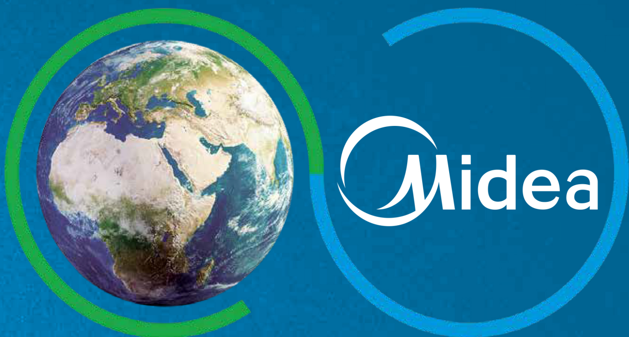
TABELA PREÇOS MARÇO 2023